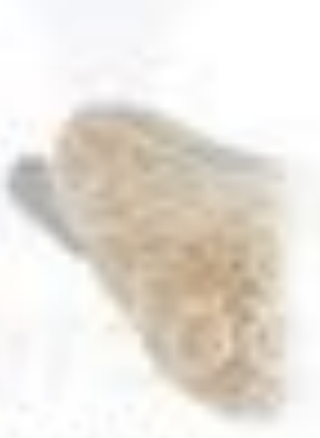
ALPDA (secondary displacement)