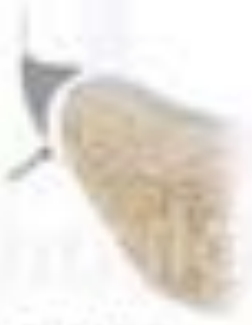
Mankin's Lesion (disorganized structure)