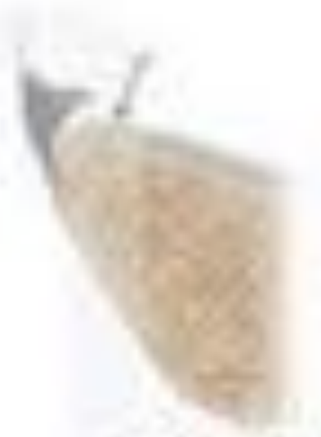
FLACD lesion (fibrin - articular cartilage lesion)