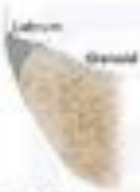
Normal Articular cartilage (uniform)